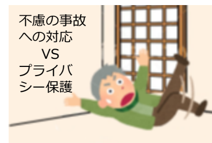
図1 成熟した社会が抱える高齢者見守りの問題