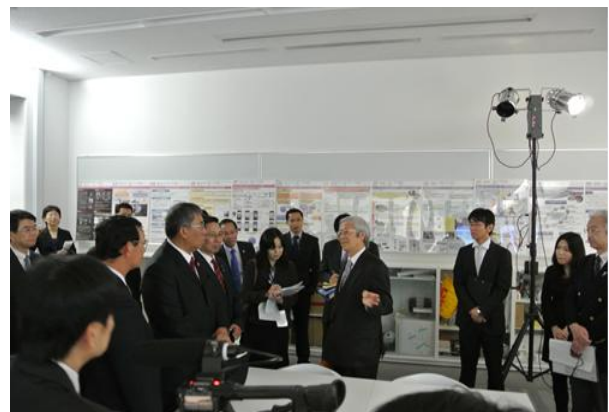
ASEAN10 か国経済閣僚等の視察の様子 (平成 24 年 4 月)