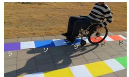
図2. 車いす利用者に配慮したアクセシブルデザイン

本研究では、都産技研のもつ静電植毛技術と首都大が有するデザイン基盤技術を融合させ、誰でも認識しやすい色を音に変換するモジュールを開発します。このモジュールを搭載した車いすを用いて、カラフルなトレーニング場で、色や音を楽しみながら操作を学ぶことで、車いす訓練や障がい者スポーツの促進に貢献していきます。