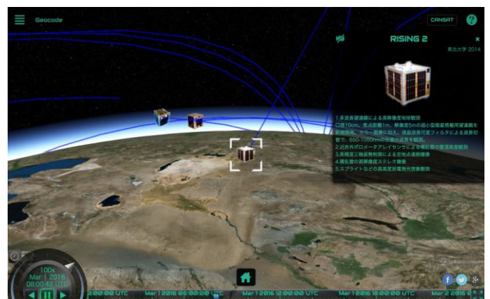
人工衛星を自動追尾