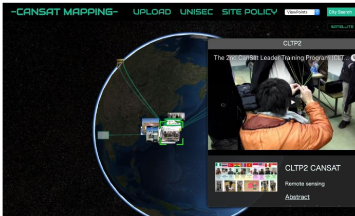
世界中の「缶サット」製作チームの情報を表示