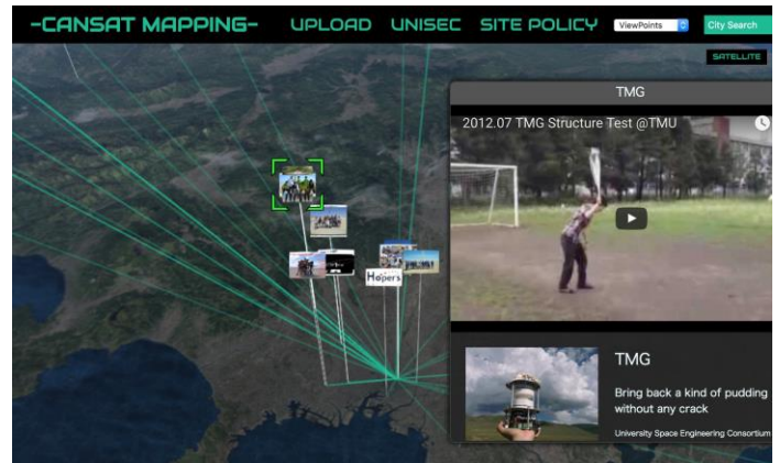
関東近辺の「缶サット」製作チーム

この事業は文部科学省・宇宙航空科学技術推進委託費の支援によるNPO 法人大学宇宙工学コンソーシアムの事業の一環として行われており、制作に当たっては、首都大学東京・渡邊英徳研究室の「ヒロシマ・アーカイブ」(2011年7月発表)などの「多元的デジタルアーカイブズ」の技術を応用しました。