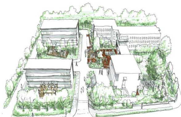
※左側2棟がグローバルハウス調布

首都大学東京では、文化・価値観等が異なる学生が共に暮らす混住型宿舎の増設は、協動的に課題解決する力の育成に資する重要な取組と位置付けており、今後も留学生の受入れや学生の国際交流活動を積極的に推進していきます。