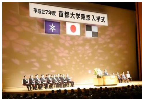
平成27年度入学式の様子