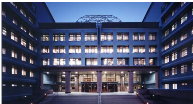
産業技術大学院大学校舎

次第 開式 学長式辞 理事長挨拶 来賓祝辞 来賓紹介 学生紹介 教職員紹介 閉式