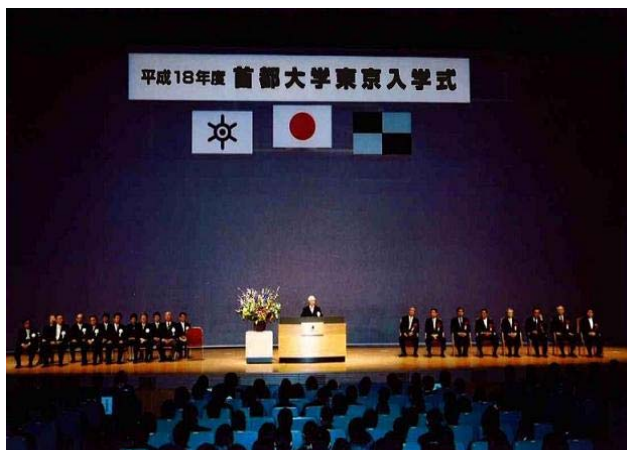
平成18年度入学式の様子