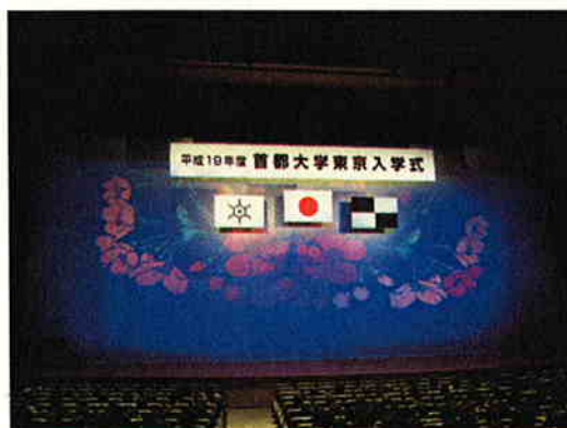
平成19年度入学式の様子