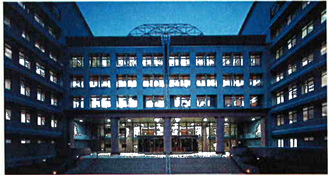
産業技術大学院大学校舎