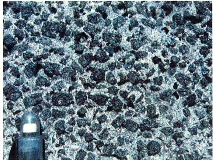
単斜輝石の大型斑晶が濃集した玄武岩