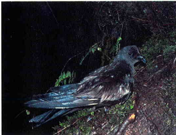
クロウミツバメの繁殖を確認