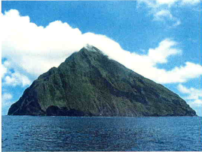
南硫黄島全景(北側)