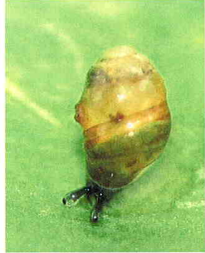
陸産貝類(キバサナギガイ属)の新種 (写真 千葉聡)