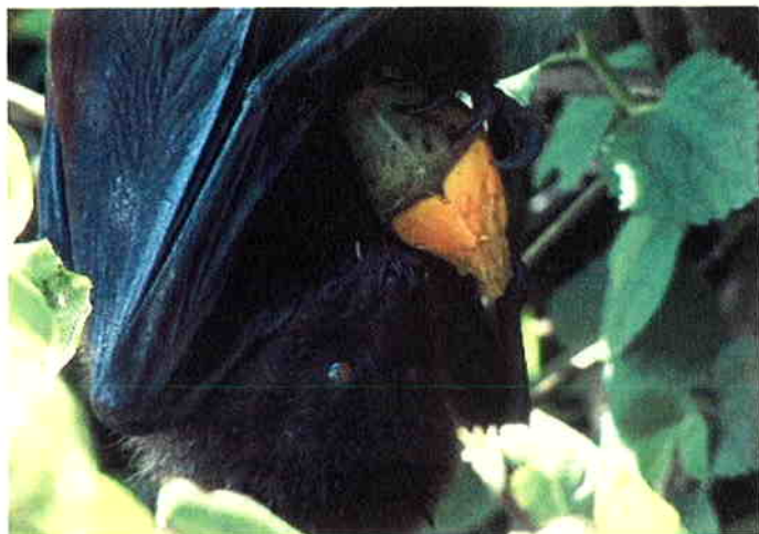
タコノキの実を食べるオガサワラオオコウモリ

現時点で判明したその他の成果や画像については、環境局HP及び首都大学東京HPにアップしますので参考にしてください。