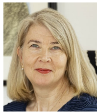
タンヤ・ヤースケライネン