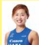
秦 由加子 パラトライアスリート