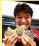
山田 真樹 デフリンピック陸上競技 金メダリスト