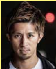
藤光 謙司 世界陸上銅メダリスト