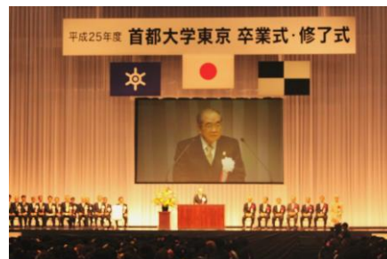
平成25年度卒業式・修了式の様子