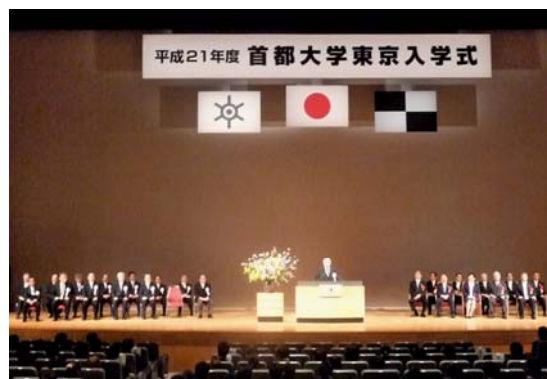
平成21年度入学式の様子