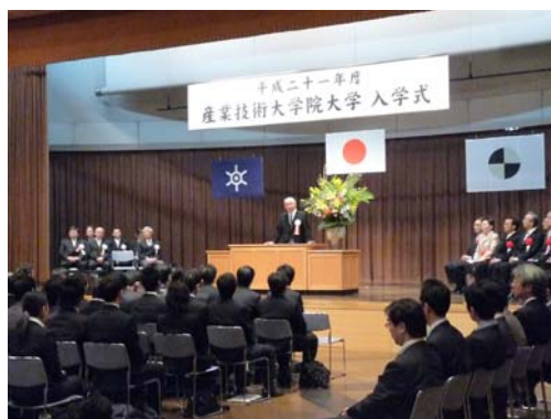
平成21年度入学式の様子

次第 開式 学生紹介 学長式辞 理事長挨拶 来賓祝辞 来賓紹介 法人幹部紹介 教員紹介 閉式