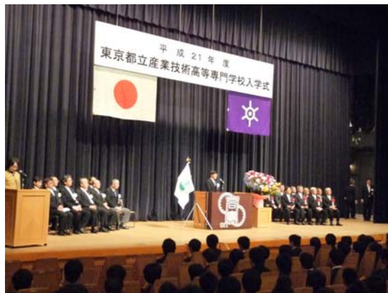
平成21年度入学式の様子